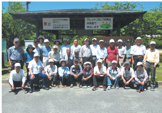
マレットゴルフ大会にも大勢参加していただきました。