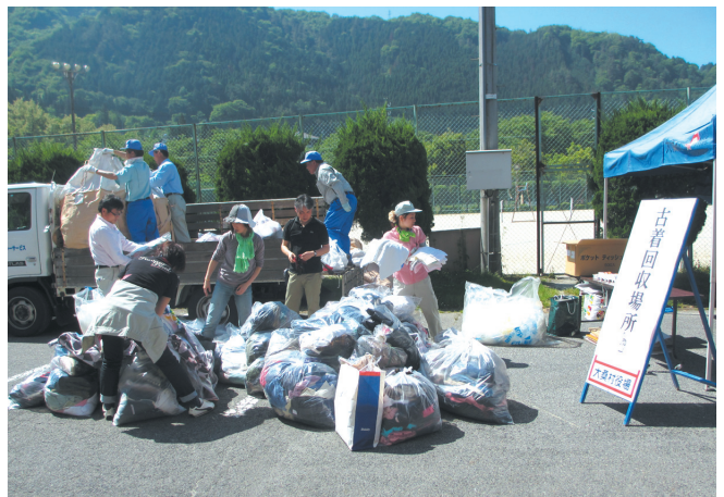
同時に開催した古着回収には多くの古着が集まりました。