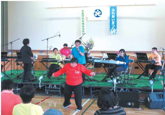
陽気なミュージシャン「ケ・セラ」による森のコンサート

参加される皆さんに「ふれあい」をより一層実感・実践していただくことを目指し、昨年からの「ふれあいまつり」と改めましたが、福祉健康まつりから数えて20回の節目を迎えました。