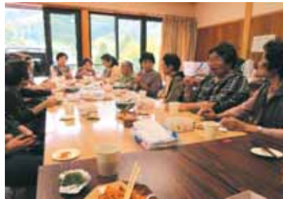
～手作り料理もいっぱい～