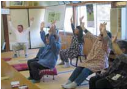
～肩こり解消！気持ちがいい～