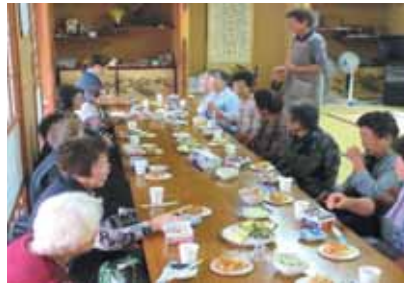
～おしゃべりに花が咲きます～