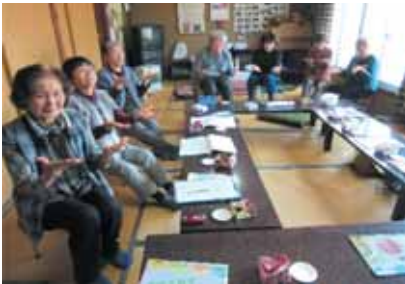
～手先を動かして脳トレ中～