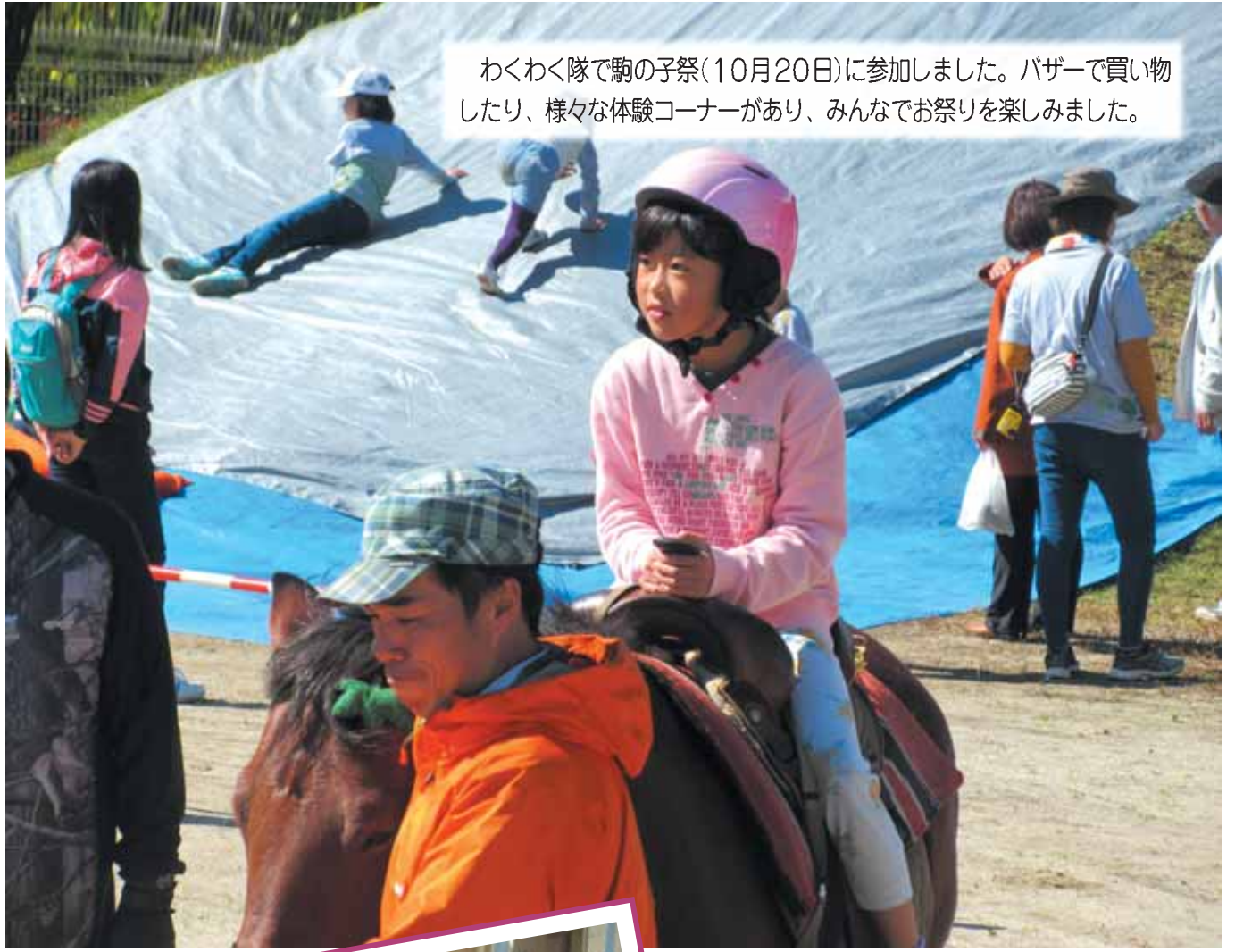
わくわく隊で駒の子祭(10月20日)に参加しました。バザーで買い物したり、様々な体験コーナーがあり、みんなでお祭りを楽しみました。