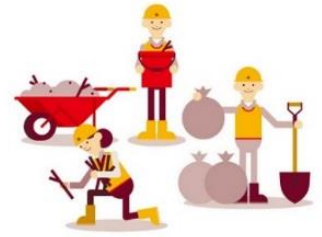
災害ボランティア支援